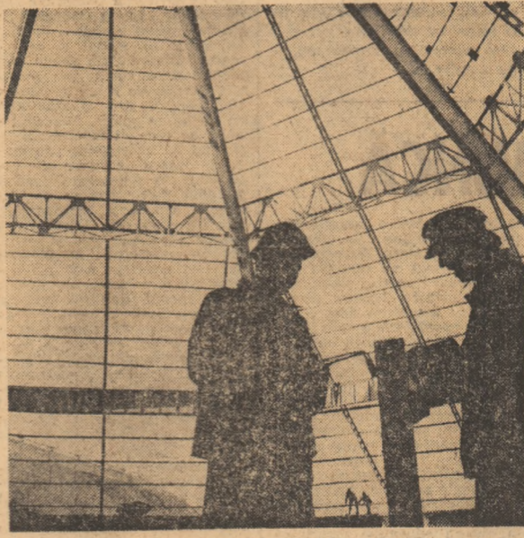
Pe șantierul Combinatului de Îngrășăminte chimice Arad

Încă 80 de apartamente și prefabricate pentru acoperirea a 22.000 metri pătrați de hală industrială.