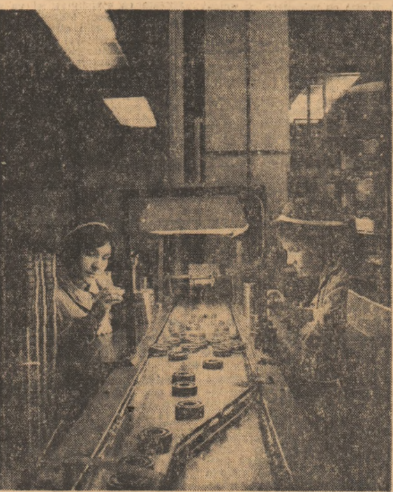
Aprecierea de care se bucură în prezent rulmentii fabricați la întreprinderea din Alexandria este urmarea atenției pe care întregul colectiv o acordă calității execuției, ridicării performanțelor tehnice ale produselor. În imagine: un aspect din secția de montaj