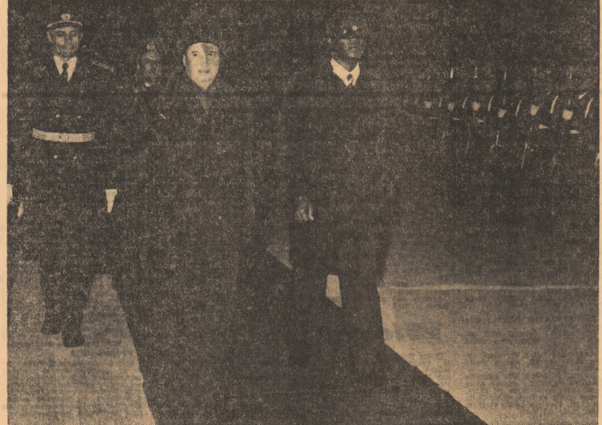
Pe aeroportul internațional Otopeni