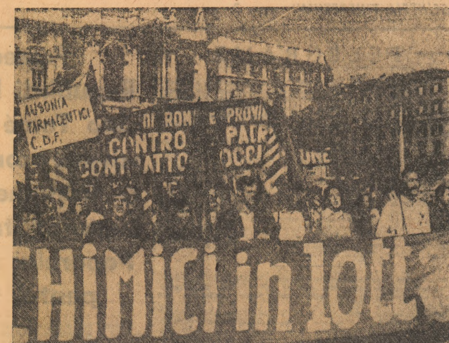
ITALIA — Demonstrația la Roma a muncitorilor din industria chimică, în sprijinul reînnoirii contractelor de muncă

● LA SFÎRȘITUL lunii noiembrie, în Spania existau 362 mii de șomeri, arată statisticile oficiale date publicității la Madrid. A