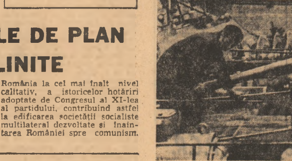
Între 20 decembrie și 11 ianuarie