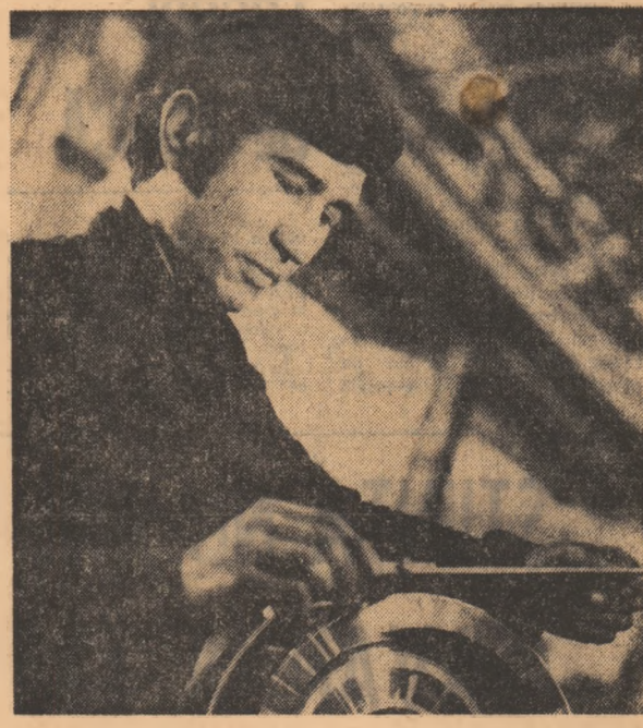
O ultimă verificare și apoi se va trece la execuția piesei

Produs de o deosebită complexitate tehnică, locomotiva Diesel-electrică de 4000 CP a fost concepută de către specialiștii Institutului de cercetări și proiectări al Centralei industriale de mașini și aparatură electrică. Dotată cu motoare puternice, ea poate dezvoltă viteze de până la 160 km pe oră.