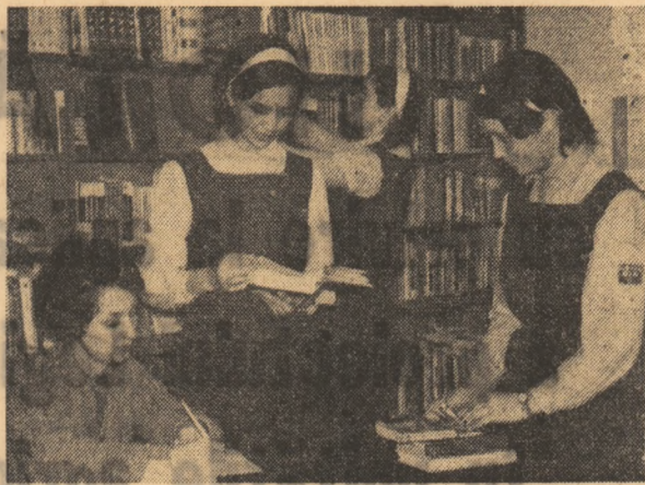
Cartea reprezintă pentru elevii Liceului economic din Buzău un prieten statornic, util și ocazional binevenit, iar biblioteca liceului oferă posibilități multiple pentru realizarea acestor deziderate.