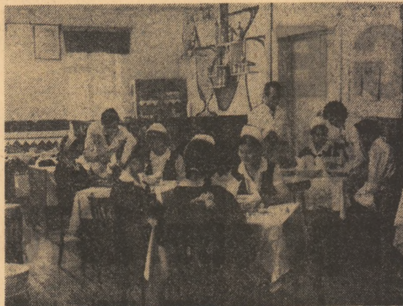
Bun gust, fantazie, ospitalitate. Ce să te simți că mai bine. Calități pe care elevii află în practică la restaurantul-clasă al școlii din Ploiești trebuie să le aprecieze cu obiectivitate. Așadar, în dublă ipostază: de consumatori și de lucrători.