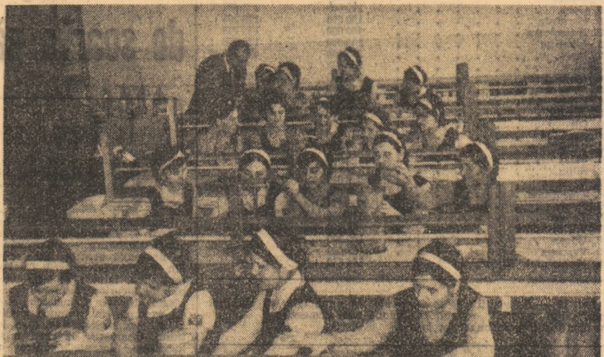
Aplicație practică în laboratorul de merceologie al Liceului economic din Buzău.