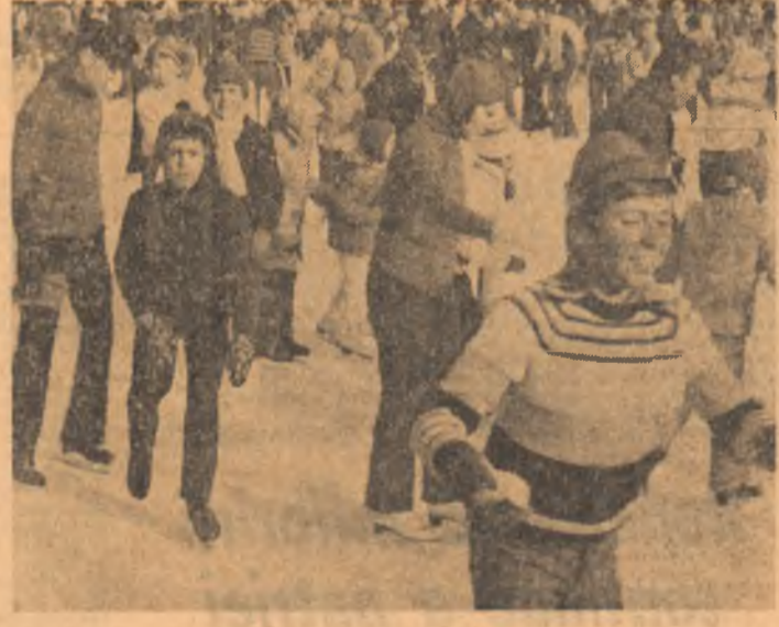
Exuberanță și explozivă, vacanța de iarnă a elevilor este prezentă pretutindeni. Noi am surprins-o la parterul biroului ca din Capitală, prea puțin încăpător în aceste zile.

mice reprezentative pentru anii construcției socialiste. Totodată, circa 50 000 de elevi din toate județele țării vor vizita Bucureștiul, cu poposuri educative și instructive la Muzeul de istorie a R.S.R., Muzeul de istorie a partidului comunist, a mișcării revoluționare și democratice din România în alte muzee și expoziții reprezentative, în noile cartiere și zone industriale.