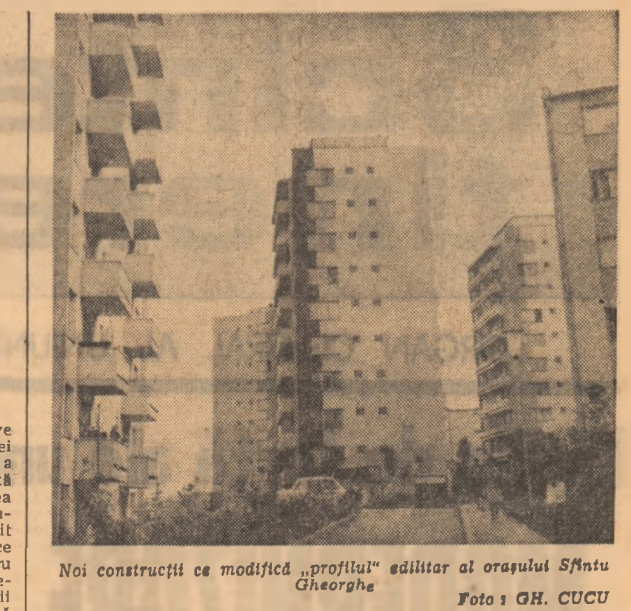
Noi construcții ce modifică „profilul” edilitar al orașului Sfîntu Gheorghe

(Urmare din pag. 1) Expoziția este un instrument de lucru. Aici funcționează de fapt, așa cum atrăgeam atenția de la început, un „centru” (uni-zic că este numai pe cate de a deveni centrul de inițiere artistică. Printre puținele de acest gen din lume. Înainte de vizionarea expoziției, pictorii profesioniști concep și execută „pe viu” în fața copiilor o natură statică, un peisaj, un portret, explică acestora o firete în cuvintele și pe înțelesul vîrstei — de ce o culoare este mai frumoasă în vecinătatea uneia și nu a alteia, de ce numim anumite lămpi „rece” sau „calde”, de ce, în desen, oamenii mari ne sînt mai apropiați și oamenii mici ne sînt mai depărtați etc. etc. Mai apoi, „cursanții” vizionează expoziția unde sînt puși să recunoască o natură statică, un portret, un peisaj, o gamă. Rezultatele sînt de-a dreptul miraculoase. Fîindcă, arareori copiii gresesc. Tot aici, în expoziție, un specialist le oferă câteva date despre întîmplările vîrstei și întîmplările mai aparte ale culorilor acestor „colegi” mai mari în ale picturii. După o vreme, din memorie, la grădinițe sau acasă, „reproduc” ceea ce au văzut, adică un Luchian, un Petruscu, un Toniză.