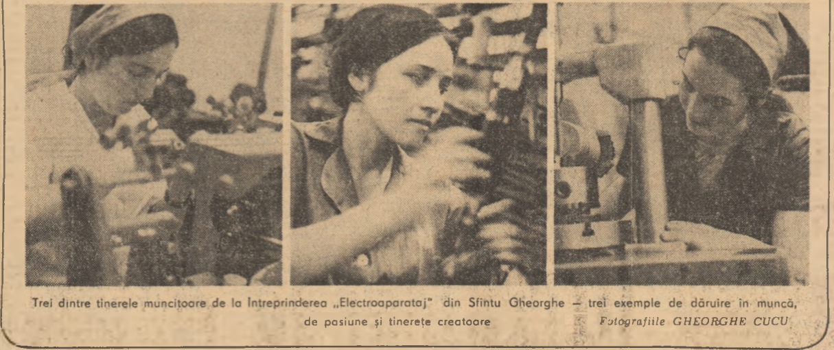
Trei dintre tinerele muncitoare de la Întreprinderea „Electroaparataj” din Sîntu Gheorghe — trei exemple de dăruire în muncă, de poziune și tinerețe creatoare