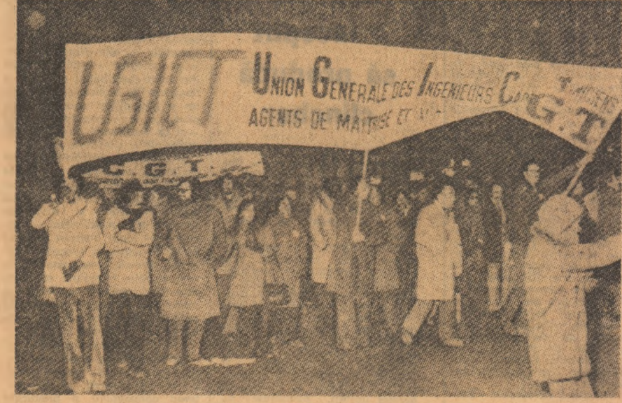
FRANȚA: Demonstrația la Paris împotriva șomajului, a creșterii costului vieții

După toate probabilitățile, consumul intern de oțel al Pieței comune se va situa în jurul a 20,7 milioane tone, ceea ce reprezintă o reducere de circa 11,7 la sută față de primul trimestru al anului 1975.