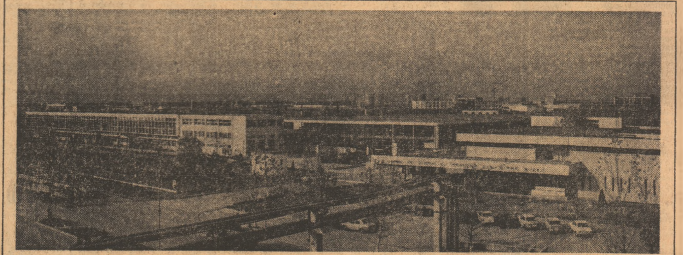
Cartea de vizită a orașului: PLATFORMA INDUSTRIALĂ Platformele industriale au devenit, în anii ultimilor cincinale, o componentă obișnuită a peisajului modern, caracteristică a dezvoltării în ritm susținut a economiei României socialiste. Buzăul, ca dealtfel, toate orașele patriei, se prezintă — la încheierea acestui cincinal — în

tive a concepției revoluționare, materialist-dialectice și istorice, a marxism-leninismului, a tot ce a creat mai avansat omenirea în domeniul cunoașterii...”. Însușirea substanțelor sale creatoare este o sarcină, o îndatorire vitală pentru fiecare om al muncii din România socialistă. Problemele atât de complexe ale construcției vieții noi, ale dezvoltării sociale se pot aprofunda, cunoaște și rezolva în clara lumină izvorâtă din paginile acestui breviar al concepției revoluționare a partidului, în paginile sale se conturează prototipul omului nou, dimensionat nu de idei și scheme abstracte, ci de trăire și experiență, pătruns de sensurile armonice ale unei morale înalte care consideră că activitatea creatoare este singura justificare existențială. (Continuare în pag. a III-a)