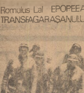
ROMULUS LAI EPOPEEA TRANSFĂGĂRAȘANULUI