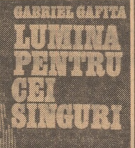
LUMINA PENTRU CEI SINGURI