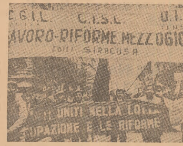
ITALIA - Demonstrație la Napoli a muncitorilor din provincia Siracusa...