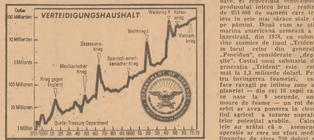
Bugetul militar al S.U.A. între anii 1971-1975, reproduc după revista vest-germană „Der Spiegel”

Ca indicator global, volumul anual al cheltuielilor destinate scopurilor militare oferă o primă imagine înarmărilor. Într-un sfert de secol, alocațiile militare au sporit de circa cinci ori...