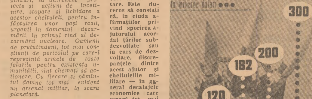
Evoluția cheltuielilor militare anuale: cu 10 la sută din nivelul actual se pot finanța necesitățile pentru hrană, educație și asistență medicală...