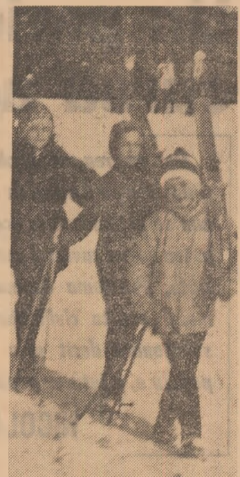
Peisaj obișnuit de iarnă. În vacanță, în concediu sau la sfârșit de săptămână — ca urmare a acțiunilor organizate de B.T.T. — mi de tineri din toate colțurile țării beneficiază de frumusețea peisajului montan, de plăcerea practicării sportului preferat — schiul