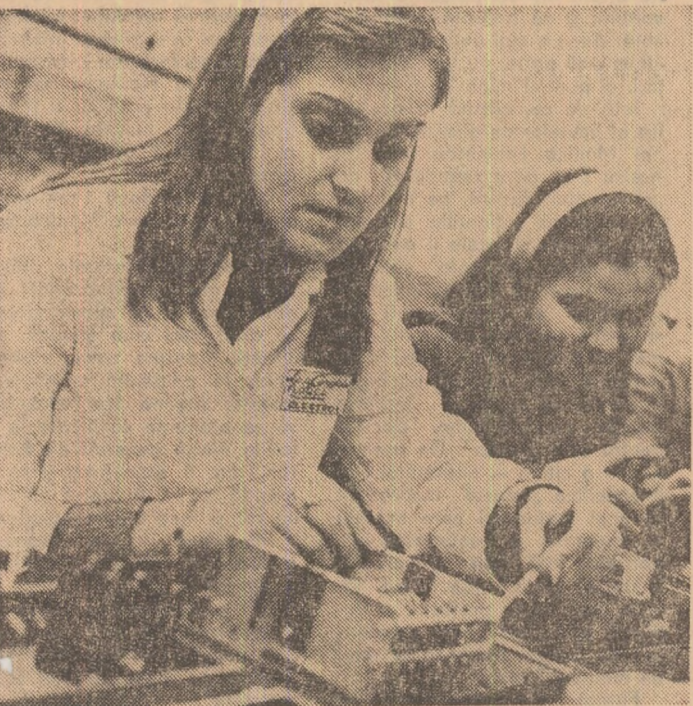
Elevii anului III E de la Liceul „Ion Luca Caragiale”, execută montarea aparatelor pentru panourile de automatizare a cazelorlor de 5 tone/abur.