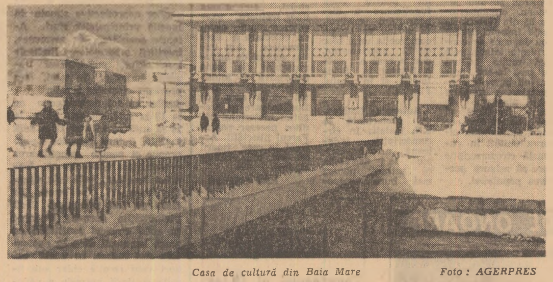
Casa de cultură din Baia Mare

— În fiecare săptămîină — o zi a noului încadru”, iată cum am formulat una din inițiativele noastre în această privință. Săptămînal, un grup de cadre de conducere din uzină, stă la dispoziția tinerilor recent veniți în colectiv și le ascultă doleanțele, pîrerile, propunerile, ajutîndu-i operativ în rezolvarea problemelor de muncă sau personale. Ca secretar al comitetului U.T.C., particip cu regularitate la aceste audiențe și pot afirma că nici un tînr nu pleacă