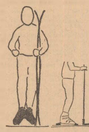
Figura 1 Figura 2