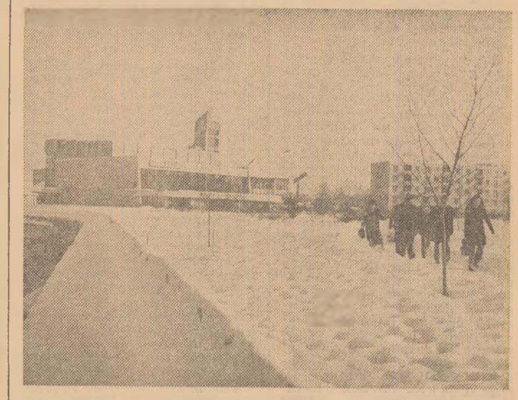
Noua și modernă clădire a cinematografului „Dacia” din Bata Mare

În pagina a 2-a • Colecția „Idei contemporane”: Prezență activă în dialogul filozofic actual • Cronica T.V.: PUBLICUL • Viața bate la ușă