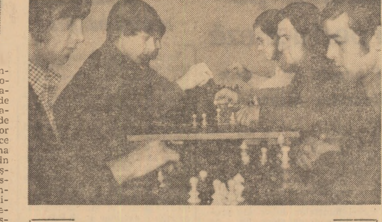
O finală cu 100 participanți

Căutătorii de comori Membrii cenaclului „România viitoare”, de la Liceul pedagogic din Tulcea, au început, sub