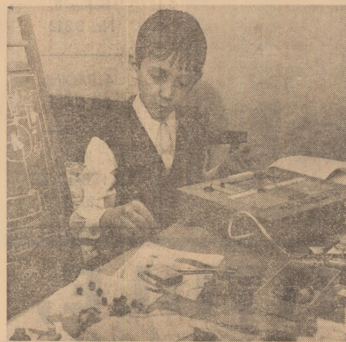
CELEBRU... LA 11 ANI