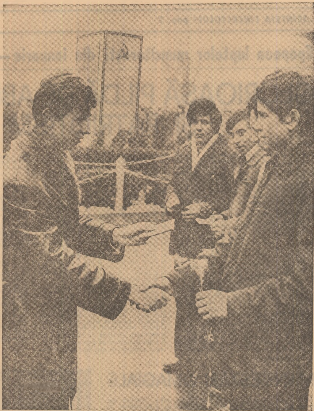
O tradiție cu valoare de simbol: înmănuirea carnetului de utecist în locurile legate de amintirea glorioaselor tradiții de luptă ale clasei muncitoare, ale partidului comunist

Pe seama sporirii productivității activității furnalului de la Combinatul siderurgic Hunedoara au produs, peste prevederi, de la începutul anului, 2 500 tone fontă. La obținerea acestui succes de prestigiu și-au adus contribuția lucrătorii secțiilor din combinat, care pregătesc materialele suplimentare în încălzirea furnalelor. Astfel, formatele de lucru de la fabricile de aglomerare a minereului plus 5 000 tone de aglomerat feros auto-fondant, iar colectivul Uzinei coșochimice a realizat o cantitate suplimentară de coș metalurgic, care poate constitui consumul tehnic necesar pentru topirea și elaborarea a peste 2 000 tone fontă. (Agerpres)