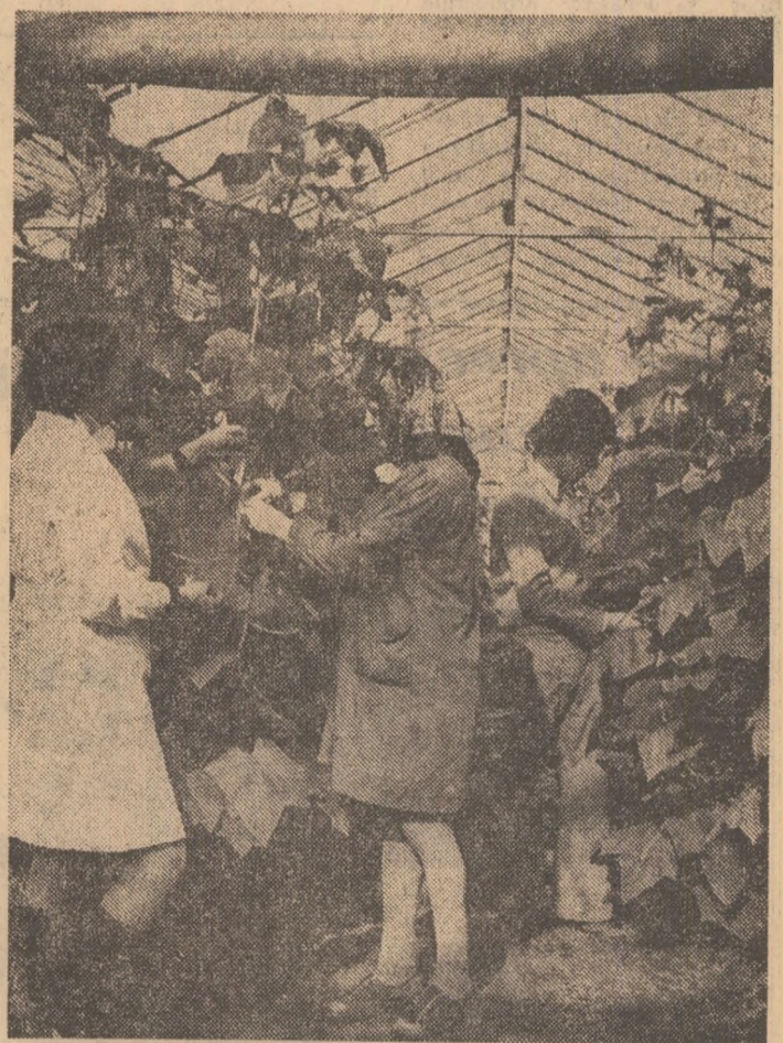
Pe agenda lucrărilor agricole de sezon se înscriu — cu caracter prioritar — și activitățile ce se desfășoară în serele legumicole. Acționînd cu perseverență, sub direcția îndrumare a specialiștilor, cooperatorii au obținut producții bune, reușind astfel o ritmică aprovizionare a pieței.