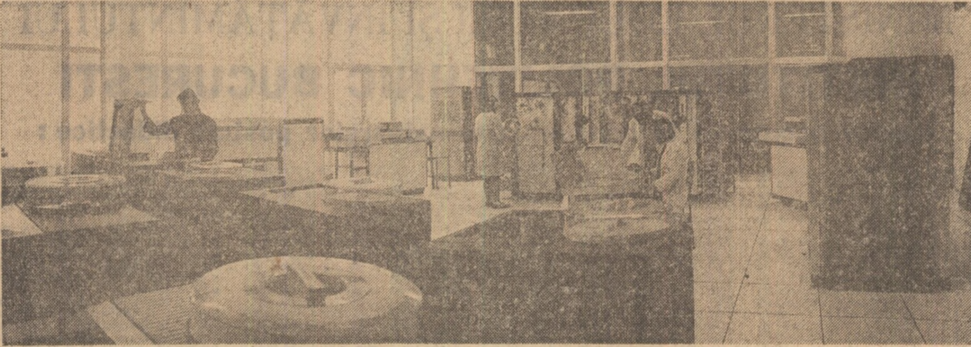
Aspect din sala calculatoarelor de la centrul teritorial de calcule electronice Pitești