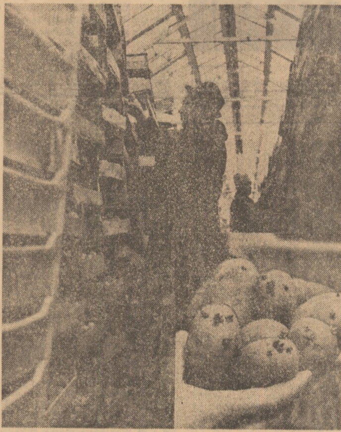
Materialul semincer pentru cartofii timpurii întrunește condiții calitative optime. Controlul permanent, calificat asigură la sera I.A.S. Mihaliești bunul mers al activității

Cum acționează, ce întreprind lucrătorii din agricultură pentru transpunerea imediată în practică a acestor indicații, iată subiectul rîndului pe care l-am întreprins ieri, la invitația Comitetului județean Ilfov al U.T.C., în marea localități și unități agricole ale județului Ilfov.