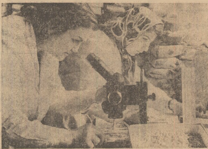
La centrul Ursiceni al întreprinderii pentru valorificarea cerealelor și plantelor tehnice-Ilfov se face un ultim control de calitate pentru loturile de semințe expediate, în aceeași zi, către unitățile agricole. Buletinele roșii eliberate asigură garanția unor viitoare producții bogate.

concrete formulate de secretarul general al partidului, tovarășul Nicolae Ceaușescu, la recenta ședință de lucru de la Comitetul Central al P.C.R., toate forțele și mijloacele existente în comune trebuie subordonate nemijlocit, și de pe acum, în vederea sporirii producției agricole vegetale și animale. Cum se acționează în aceste zile în unitățile agricole?