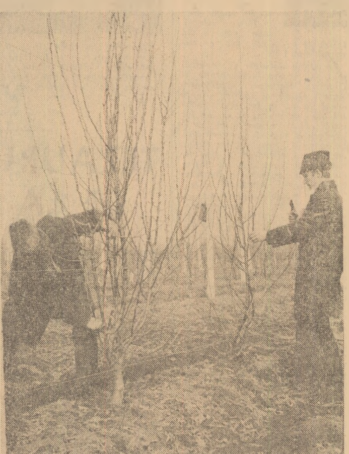
În livada fermei Crevedia se execută tăierile de formare și rodire

Declarată sau nu, cea dintîi zi de muncă din SĂPTĂMÎNA POMICULTURII, prin amplă mobilizare de forțe și inițiative, prin rezultatele ei, s-a constituit într-o ZI RECORD. Înțelegem ca o înaltă datorie patriotică, de la un capăt la altul al țării, tînăr și vîrstnic, bărbat și femeie, au devenit în această săptămîină, rîmîn în continuare — întîrind o tradițională îndelungă — veritabili pomicultori. Este convingerea cu care, la ceasurile tîrziu ale zilei, consemnăm faptele unui întiner al hîrniciei, al dăruirii pentru rodul ei mai bogat al livezilor.