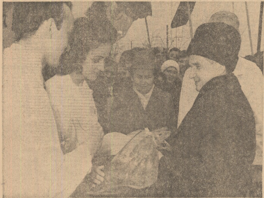
Caldă manifestare de stimă și dragoste la sosirea în Institutul central de cercetări pentru electronică, electrotehnică, automată, mașini-unelte și mecanică fină

și o dată Ordinul Steaua Republicii Socialiste România clasa I. Condusă de academicianul doctor inginer Elena Ceaușescu, această prestigioasă instituție științifică și tehnologică coordonează întreaga activitate de cercetare științifică și dezvoltare tehnologică a tuturor institutelor de profil din ramura chimiei, a institutelor departamentale, a cadrelor de chimie din învățămîntul superior, sectoarelor de cercetare și dezvoltare industrială, precum și a unor uzine chimice destinate producției de mic tonaj.