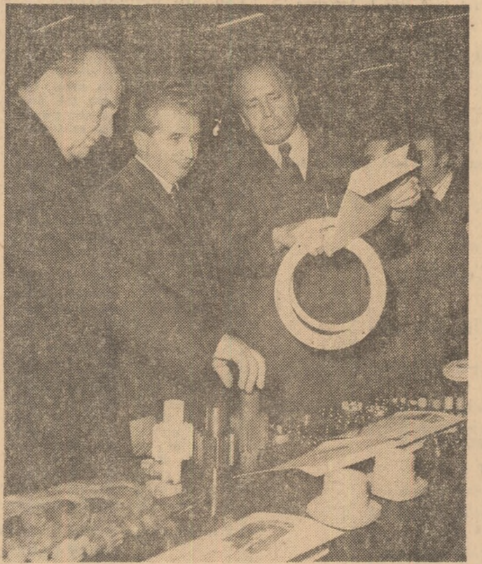
La Institutul Central de Cercetări pentru Construcții de Mașini — dialog rodnic pentru intensificarea creației tehnico-științifice proprii