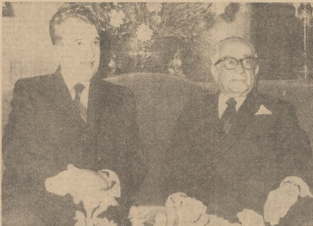
Convorbire cordială între tovarășul Nicolae Ceaușescu și președintele Constantin Tsatsos

Conferirea titlului de membru corespondent al Academiei din Atena tovarășei Elena Ceaușescu • Cuvîntarea tovarășei ELENA CEAUȘESCU