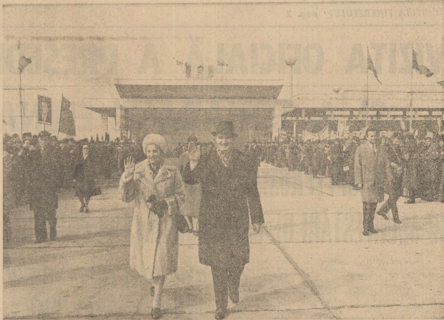
La plecare, pe aeroportul Otopeni

Un moment de mare însemnătate în dezvoltarea conlucrării multilaterale, în întărirea relațiilor prietenești dintre popoarele română și elen