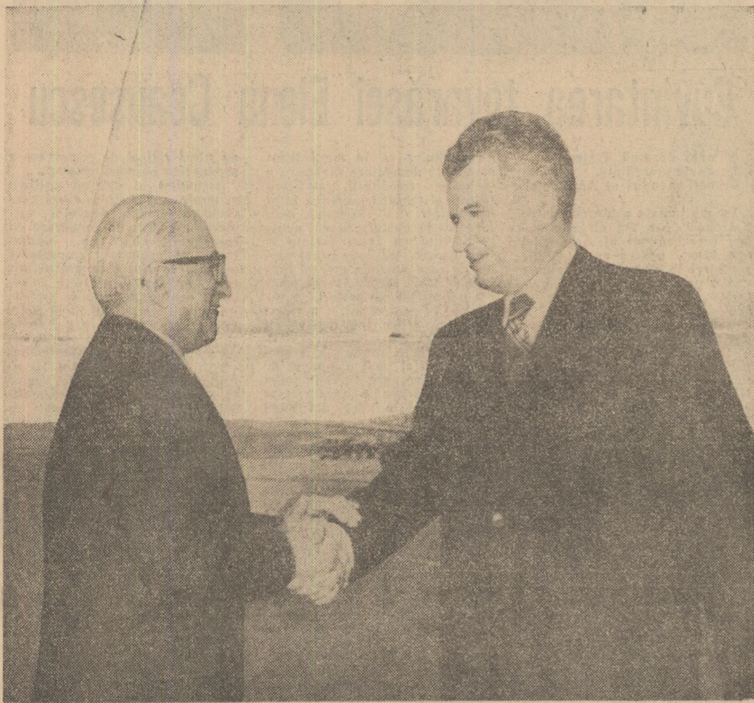
Pe aeroportul Olympic, momente solemne ale festivității consacrate sosirii înalților soli ai poporului român

Înălții oaspeți români primiți sărbătorește, cu manifestări de caldă și sinceră prețuire