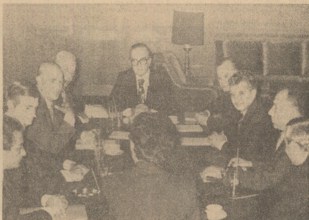
În timpul întrevederii dintre președintele Nicolae Ceaușescu și premierul Constantin Karamanlis