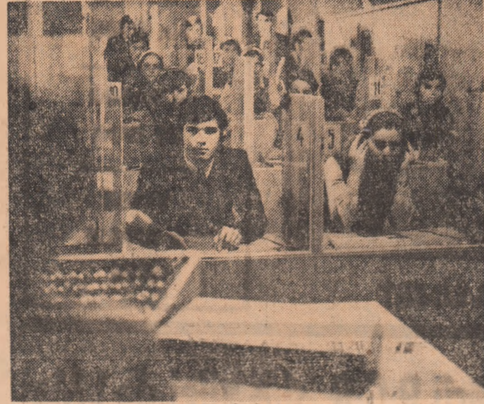
In laboratorul de limbi străine de la Liceul nr. 2 din orașul Bucușeni.