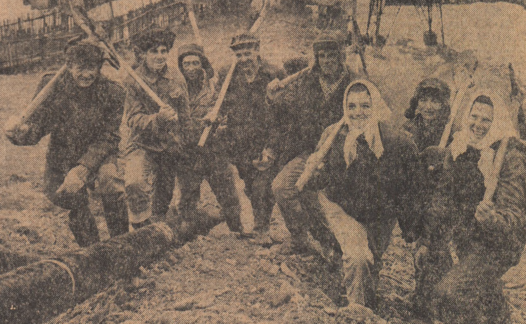
La Șantierul tineretului de la Ostra peste 200 de uteciști au făcut să răsune, din nou, în această primăvară munții, de cîntecul brigadierilor care vor construi, aici, cinci obiective de investiții