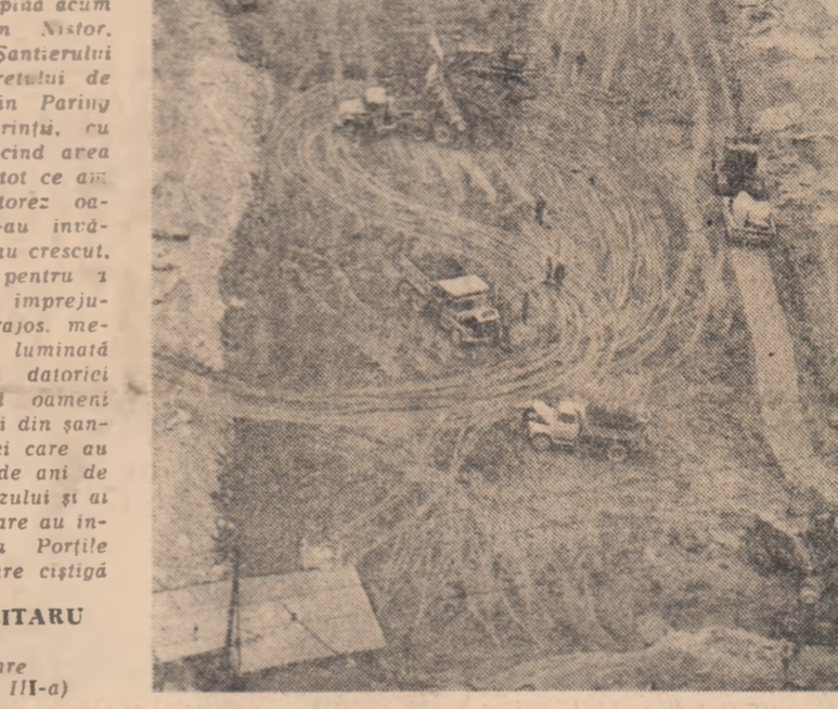
NICOLAE MILITARU (Continuare în pagina a 111-a)

MIHAI GROZAVU (Continuare în pag. a 11-a)