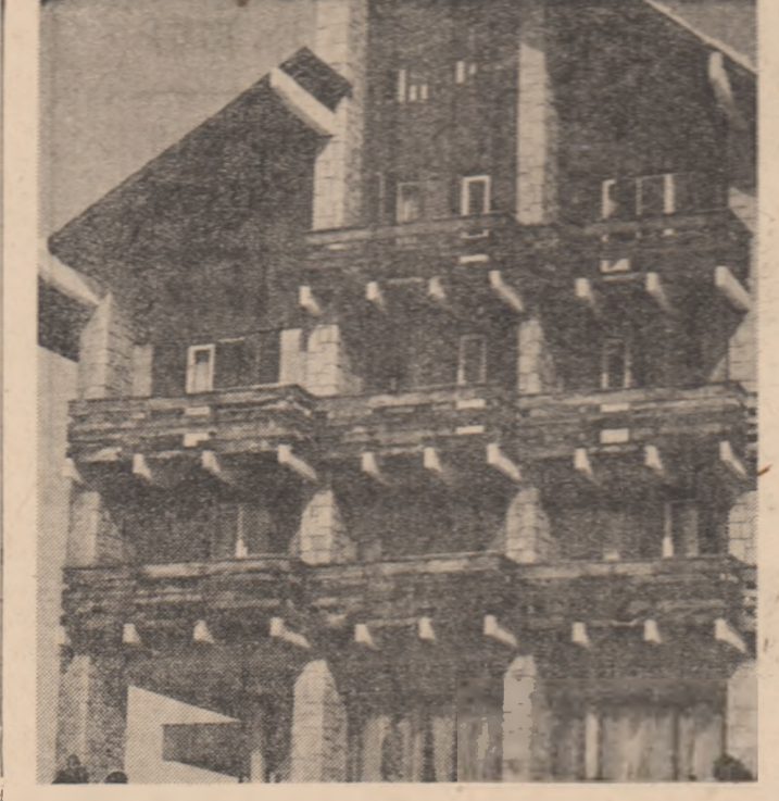
Acolo de unde iarna nu se îndură să plece, spre bucuria schiorilor: Cabana Clăbucet-plecare