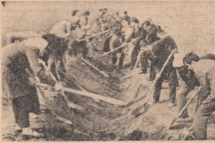
La Vîrtopale, tinerii participă la efectuarea taluzatului pe canalele sistemului de irigații amenajat pe plan local, în cadrul unui șantier al muncii patriotice