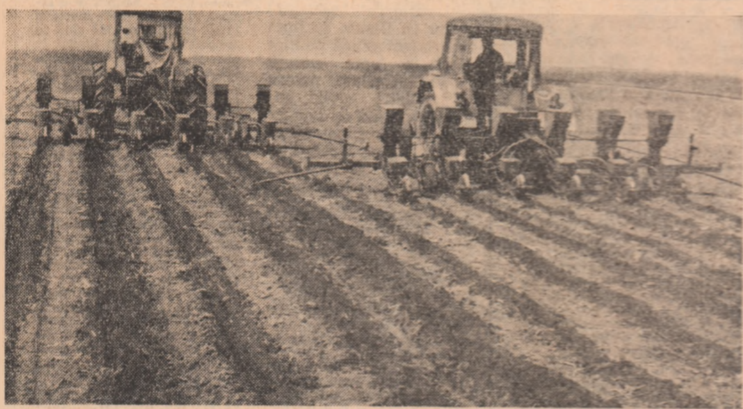
Semănatul porumbului, o lucrare de sezon care trebuie impulsionată printr-o participare activă a mecanizatorilor și o supraveghere atentă a specialiștilor. În imagine, pe tarlălele cooperatizei agricole Orbeasca, județul Teleorman.