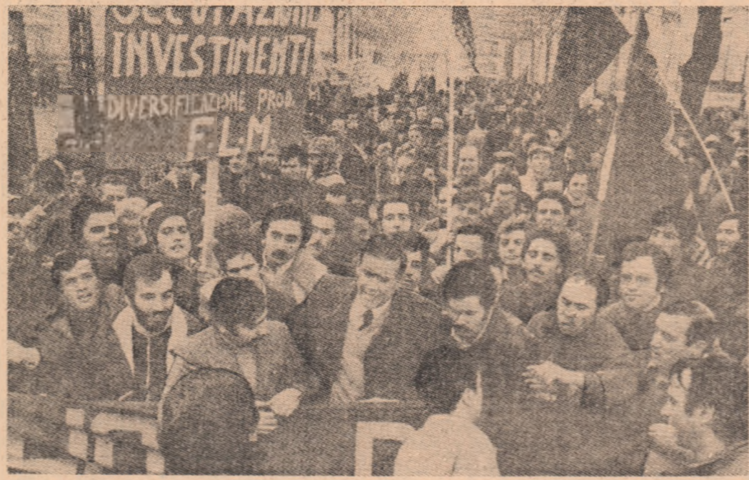
ITALIA — Demonstrație a muncitorilor de la uzinele „Fiat” pentru reinnoirea contractelor de muncă

Referindu-se la sistemul de cooperare industrială pe care O.N.U.D.I. urmează să-l organizeze, vorbitorul a subliniat că un astfel de sistem va trebui să folosească formele de participare, reprezentare și informare sistematică a statelor membre O.N.U.D.I. în conformitate cu principiile dreptului internațional, cum sint deplina egalitate în drepturi, respectul independenței și suveranității naționale, neamestecul în treburile interne și avantajul reciproc. În încheierea șefului delegației române a subliniat importanța și actualitatea integrării plene a femeilor și tineretului în procesul dezvoltării, salutând preocupările O.N.U.D.I. de a sprijini eforturile în acest domeniu.