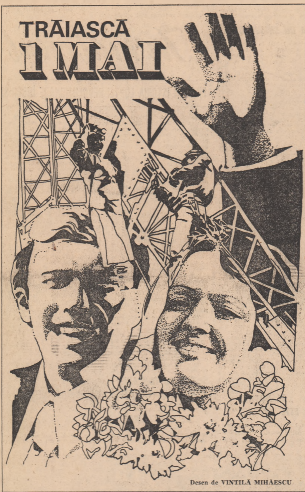
Desen de VINTILĂ MIHAESCU