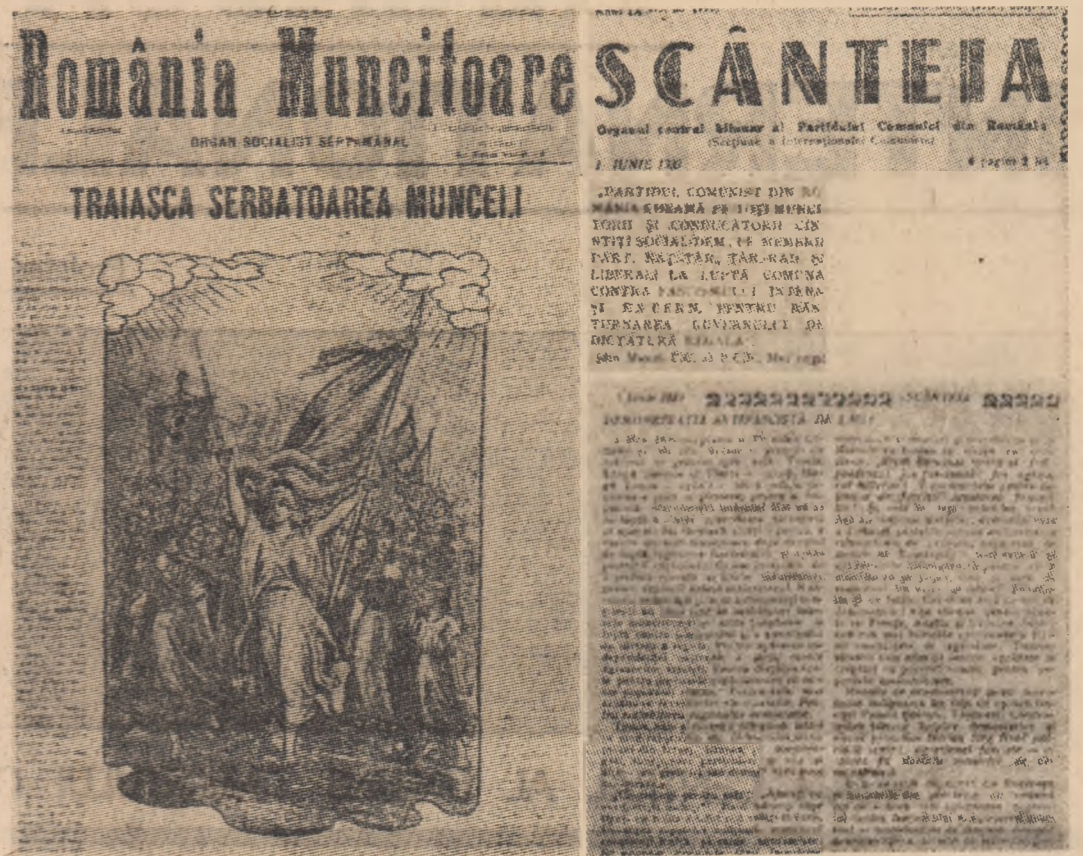
Prima pagină a ziarului „România muncitoare” apărută festiv cu prilejul zilei de 1 Mai 1902

An după an, muncitorimea devine mai puternică, se afirmă cu mai multă vigoare în viața politică și socială. An după an, sărbătorirea zilei de 1 Mai devine tot mai mult o tribună de luptă. De multe ori lupta s-a dat pentru însuși dreptul de a sărbători această zi istorică. Ca în 1895, de pildă, cînd guvernul a încercat zadarnic să-i opreas-