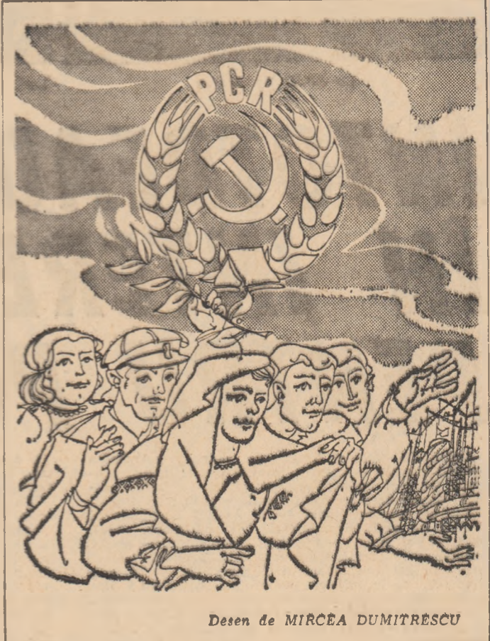
Desen de MIRCEA DUMITRESCU