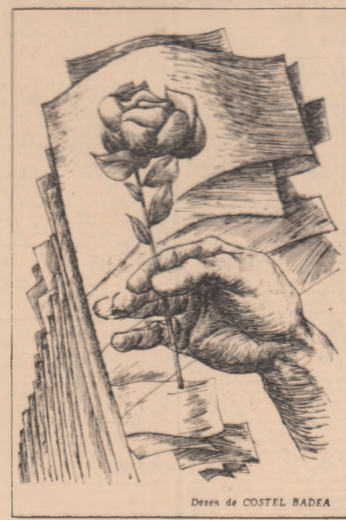
Desen de COSTEL BADEA