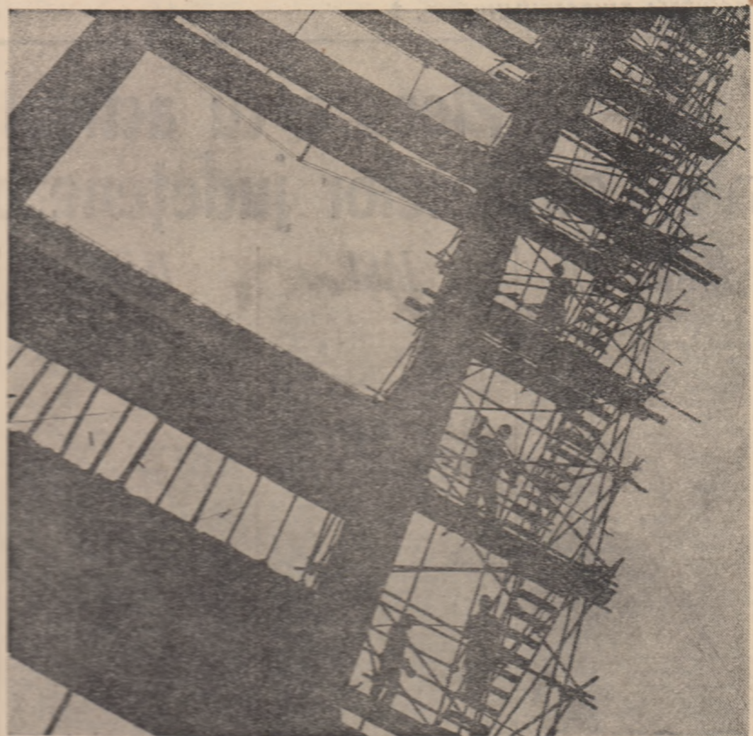
„Silveta”