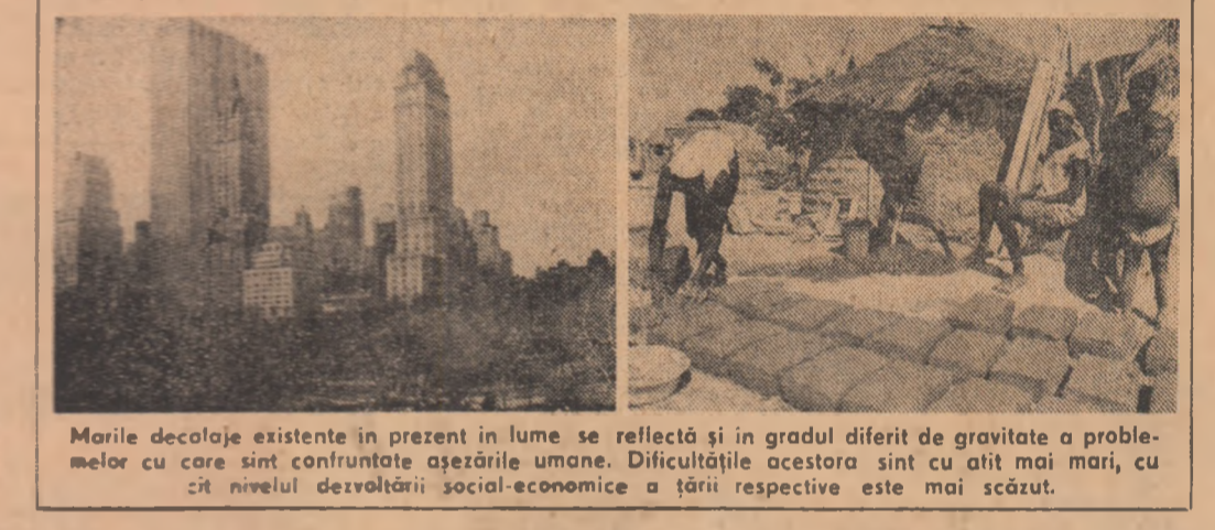
Marile deșerte existente în prezent în lume se reflectă și în gradul diferit de gravitate a problemei cu care sînt confruntate așezările umane. Dificultățile acestora sînt cu atât mai mari, cu cît nivelul dezvoltării socio-economice a țării respective este mai scăzut.

UNDE ȘI CUM LOCUIESC OAMENII În prezent, 10 la sută din pămîntul, adică în jurul a 1,6 miliarde, trăiesc în orașe, iar pentru sfîrșitul acestui secol prognozele elaborate de organisme internaționale prevăd o creștere la 50 la sută a ponderii populației urbane. Cu alte cuvinte, numărul orașurilor se va dubla, în termeni absoluți, în anul 2000 față de 1975. Creșterea populației înseamnă, deci, în primul rînd o explozie urbană generatoare a multor și complexe probleme. Cum și unde locuiesc, cum și unde vor locui oamenii de decenii întregi — aceasta este tematica deosebit de importantă a Conferinței Națiunilor Unite pentru Așezările Umane, care se va desfășura în perioada 1-16 iunie 1976 în orașul canadian Vancouver.