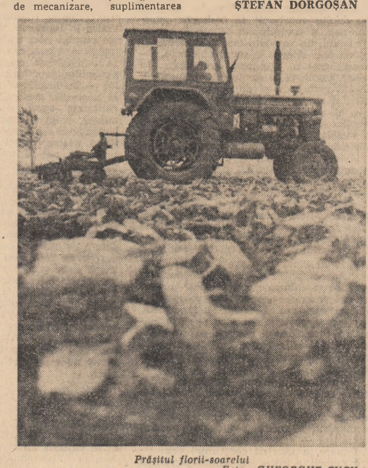
Prășitul forții-soarelui.