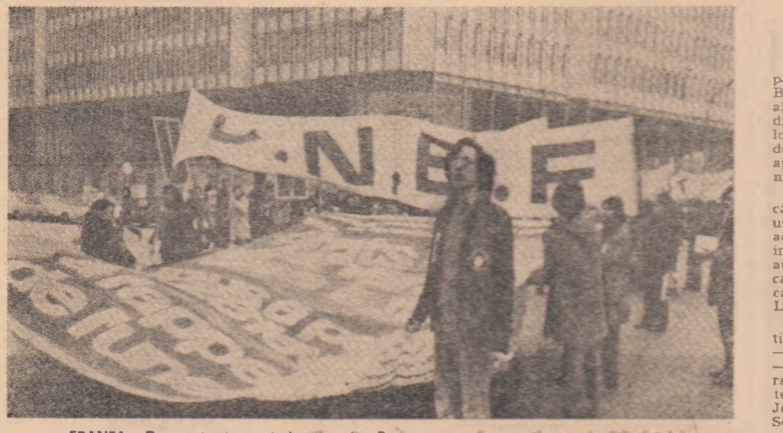
FRANȚA: Demonstrație a studenților din Paris pentru democratizarea învățământului