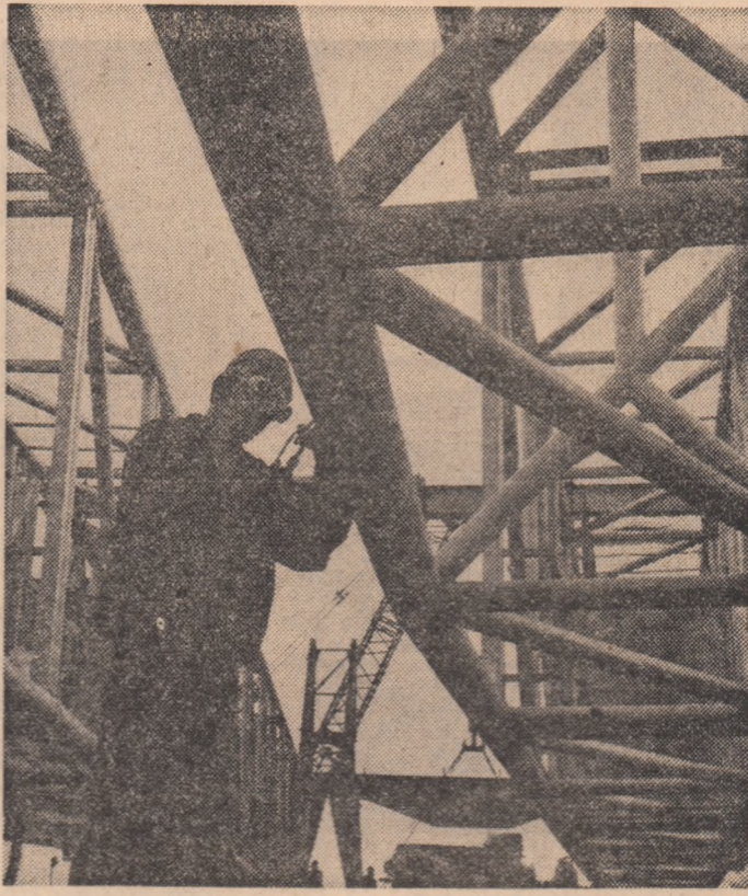
La întreprinderea „I. Mai“ din Ploiești se montează o nouă instalație de foraj destinată exportului

tinue îl constituie însuși faptul că aici, la numai cîteva luni de la debutul productiv, planul a fost îndeplinit, că în modestul atelier de creație, recent constituit, tinerii au realizat întreaga gamă de modele prezentate și acceptate a se introduce în fabricație în luna iunie. Dar, pentru acest colectiv aflat la început de drum, care se confruntă încă cu multe greutăți, îndeplinirea planului echivalează cu o adevărată probă de maturitate.