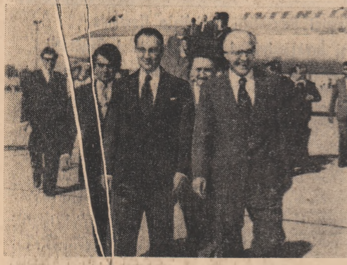
Miercuri a sosit la Berlin, în vizita oficială de prietenie, tovarășul Manea Mănescu, prim-ministru al Guvernului Republicii Socialiste România. Pe aeroportul Schönefeld, împodobit sărbătoresc, cu dra-