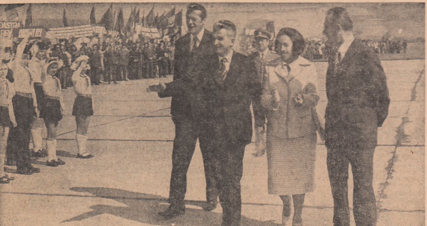
CLUJ-NAPOCA: Primire sărbătorească, cu manifestări de aleasă stimă și prețuire

Am trecut cu succes la înfăptuirea cincinalului 1976-1980, a hotărârilor Congresului al XI-lea, care asigură ridicarea patriei noastre la un nivel tot mai înalt de dezvoltare economică-socială și, în același timp, creșterea bunăstării materiale și spirituale a întregului popor. În primele cinci luni ale primului an al noului cincinal, pe întreaga țară oamenii muncii au realizat cu succes sarcinile de creștere a producției industriale, obținînd și o producție suplimentară. În acest ca-