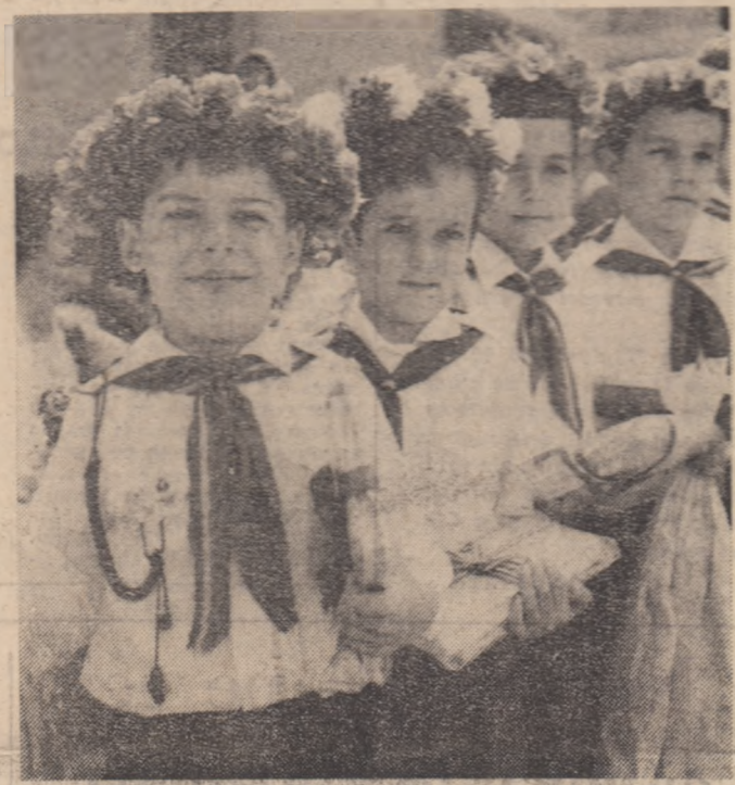
Ieri, cu prilejul „Zilei pionierilor”, în școlile generale din întreaga țară s-au desfășurat serbări de sfîrșit de an școlar. Cei mai bine pregătiți au trăit emoțiile momentelor în care și-au auzit numele în rîndul premianților