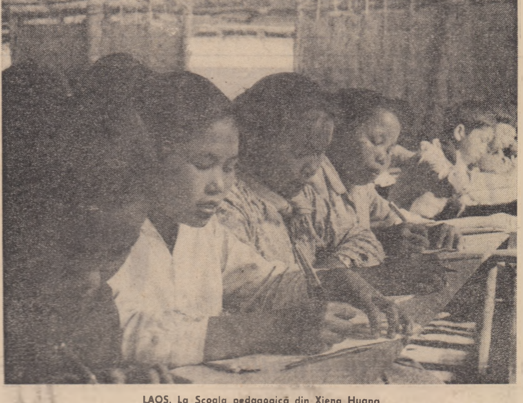
LAOS. La Școala pedagogică din Xieng Huang

GH. SPRINȚEROIU Varsavia, 20 iunie, 1976