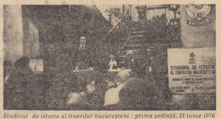
Studioul de istorie al tinerilor bucureșteni: prima ședință, 21 iunie 1976

„În educarea socialistă a maselor, cunoașterea istoriei proprii constituie un factor important al dezvoltării conștiinței de sine a poporului...”