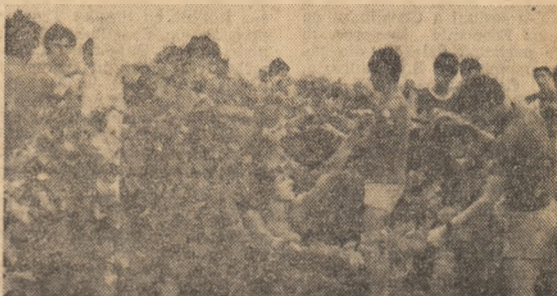
Elevii Liceului „B. P. Hașdeu” din Buzău participă la lucrările de via pe parcelele Stațiunii de cercetări Pietroasele