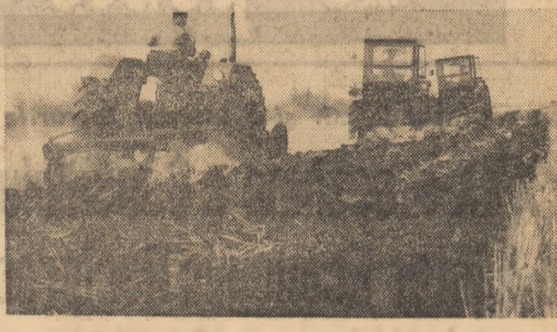
După secerat, plugurile răstoarnă imediat brazdele în care seamănă porumbul