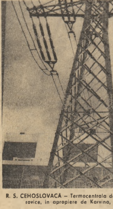
R. S. CEHOSLOVACA — Termocentrală de 800 MW de la Detmarovice, în apropiere de Karvina, nord Moraviei

AGENȚIA D.P.A. INFORMEAZĂ că, miercuri seara, a început din viață Gustav Heinemann, fost președinte al R.F. Germaniei.