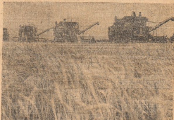
În lanurile C.A.P. Cosereni, județul Ilfov, secerișul se desfășoară nemturat. Dealul, același peisaj, același ritm de muncă intens poate fi în aceste zile întâlnit în toate unitățile agricole.