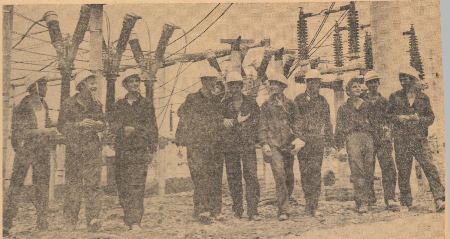
Imaginea tineretii, prezentat acolo unde o cheamă țara, dăruită cu pasiune muncii efortului constructiv, înălțării patriei socialiste, prin brațul și mîntea sa, culezătoare.

La 7.000 de locuitori, e o țară cu satele răsfrîte pe-aicea Steiului, într-o ma, județului Bistrița-Năsău un anumit limbaj aditiv-medical, a câte-gorret „circumscripție sațreia“. Aceasta presupuneri mai mari în vedderperii optime cu a-sisistată a întregii arii locali înseamnă și adegale orice experime — picior, noaptea — pentru că, jine, „urgențele“ nu precum veni la dispen-centră de comună. Daui „greu“ mai în-terestată profesional, seadompetență, pastine, oradn partea celor care au i sănătatea lechin-te-nimentul se află la anturce „popasuri“ ale unei medici repartizate un zic lungul anilor, mai bine unor „medici pasage n-au rezistat la conin „circa“, sau poate n-a în ei marea și a devhemare a meseriei. Asam într-o seară, cautîc Lechința pe doctorul Măgherusan, medic de in același timp vice-cept al Societății de magenerali din Roma-nia. Mici O greșală: vice-cepte acestei societăți stîrîalește și muncește acipape 500 de kilome-tri cesti.