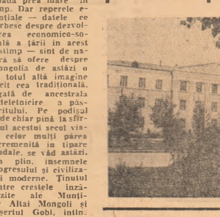
Un număr de 91 de persoane de culoare inculcate în urma incidentelor care au avut loc la Pretoria acum trei săptămîni sînt menționate în detențiune, în așteptarea procesului care va avea loc în fața tribunalului din capitală.

Ziua de 11 Iulie înserie o dată de răscruce în istoria poporului mongol. Se împlinește 55 de ani de la victoria Revoluției populare mongole, în faptușă sub conducerea Partidului Popular Revoluționar Mongol. În urma istoricele victorii, la aceași dată în 1921, în iulie 1921 a fost instaurat primul guvern popular al țării, iar trei ani mai tîrziu, în noiembrie 1924 a fost proclamată Republica Populară Mongolă. Desigur, cinei decenții și jumătate în istoria unei țări nu reprezintă în sine o perioadă prea mare în timp. Dar, în prezent, adevărată și esențială — datele care vorbesc despre dezvoltarea economică-socială a țării în acest timp — sînt de natură să ne delecte. Mongolia de azi — o țară în care s-au realizat din plin visele de dezvoltare — este în prezent un pic alături de țările socialiste și tehnico-stiințifice din lumea noastră. Desigur, cinei decenții și jumătate în istoria unei țări nu reprezintă în sine o perioadă prea mare în timp. Dar, în prezent, adevărată și esențială — datele care vorbesc despre dezvoltarea economică-socială a țării în acest timp — sînt de natură să ne delecte.