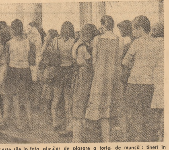
FRANȚA: O imagine obișnuită în aceste zile în fața ofițiilor de plasare a forței de muncă: tineri în căutarea unui loc de muncă

Se estimează că rezervele mondiale de țifet sînt de 90 miliarde tone, din care peste jumătate în Orientul Apropiat și 3,4 miliarde tone în Europa de vest.