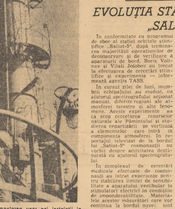
R. P. POLONĂ: Se lucrează la montarea unor noi instalații la Combinatul petrochimic din Ploiești

Președintele R. P. Congo a evocat vizita efectuată în această țară de tovarășul Nicolae Ceaușescu în 1972, considerată ca un moment de importanță istorică în dezvoltarea relațiilor de prietenie și colaborare dintre popoarele României și R. P. Congo. Toțolan, a apreciat relațiile actuale dintre cele două țări ca fiind foarte bune, exprimându-și convingerea că ele se vor dezvolta și mai mult.