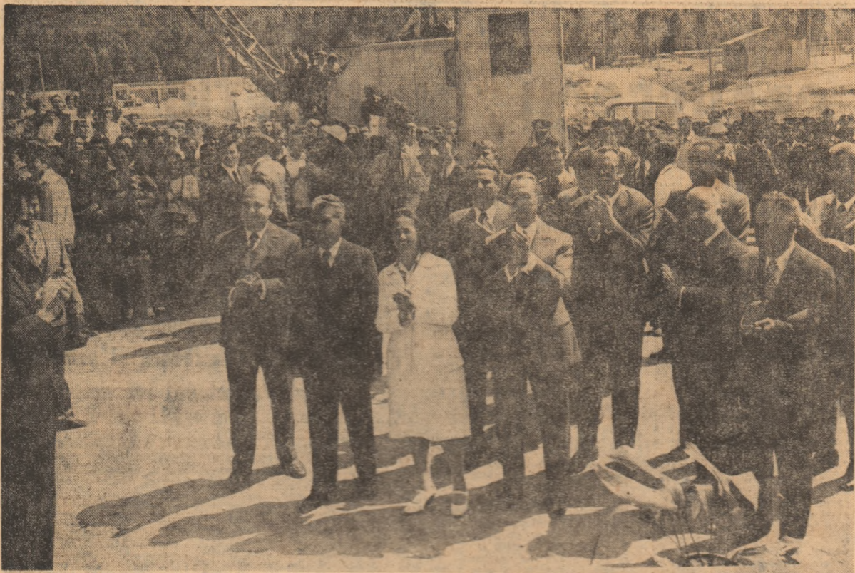
Moment deosebit în cronică muncitorească a Iașului: inaugurarea lucrărilor pe Șantierul Combinatului utilaj greu