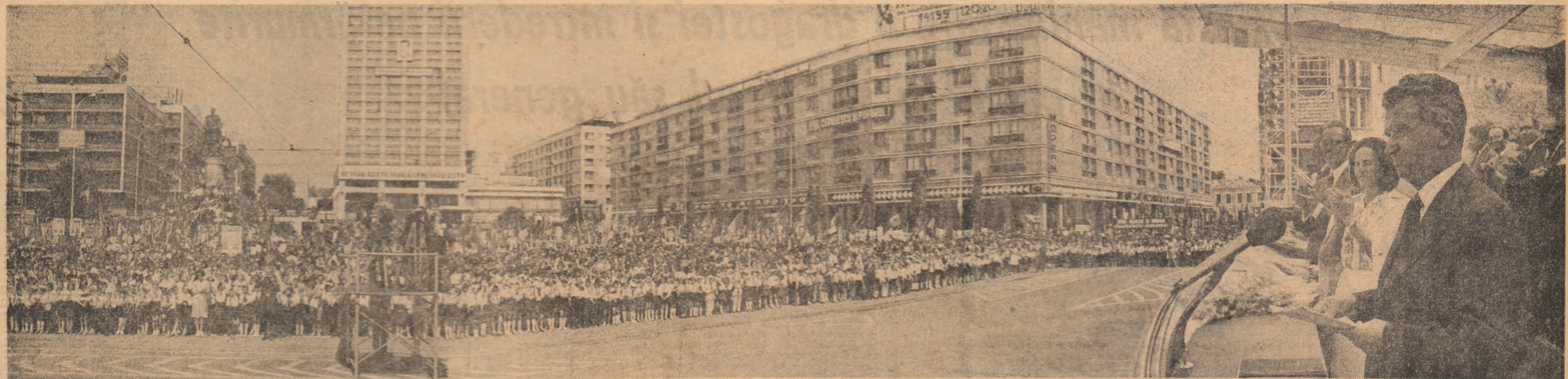
Aspect de la marea adunare populară din Piața Unirii