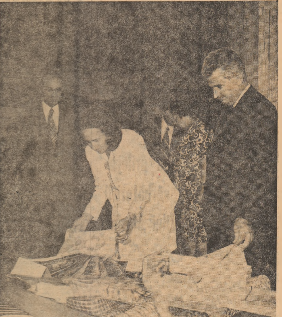
Se examinează cu atenție fesăturile și confecțiile lucrate efectiv de studenții Facultății de industrie ușoară

Doresc să vă mulțumesc dumneavoastră, tuturor cetățenilor care ne-au făcut o primire călduroasă. Vedem în aceasta o expresie a hotărîrii dumneavoastră de a face totul, la fel ca întregul nostru popor, pentru a da viață Programului elaborat de Congresul al XI-lea al partidului nostru. În încheiere, doresc să vă urez încă o dată succese tot mai mari în întreaga activitate din toate sectoarele, multă sănătate și multă fericită! (Aplauze puternice, prelungite; se scandează „Ceaușescu — P.C.R.”, „Ceaușescu și poporul!”. Cel prezenți în marea piață a orașului ovaționează îndelung pentru Partidul Comunist Român, pentru Comitetul Central, pentru secretarul general al partidului, tovarășul Nicolae Ceaușescu).