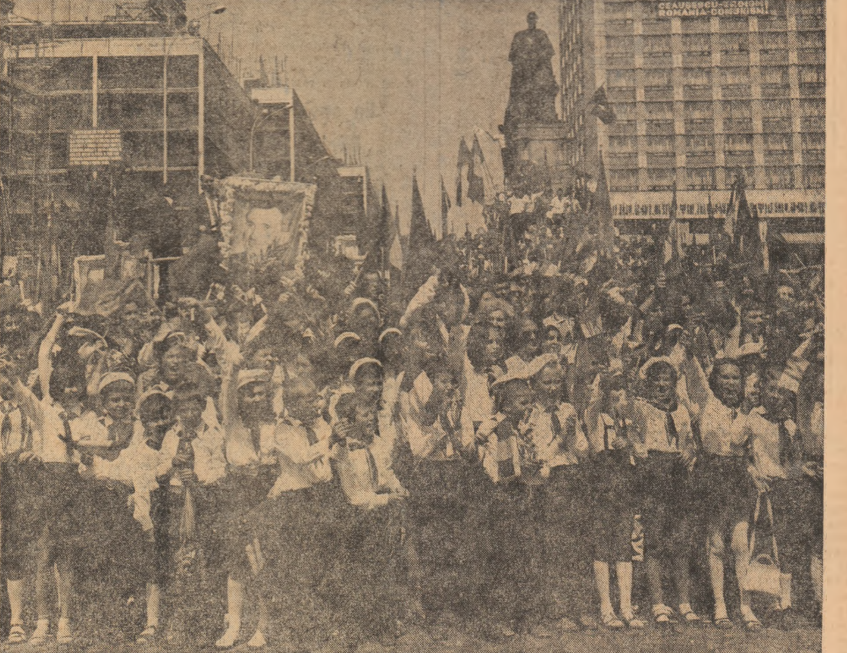
Primire călduroasă, emoționantă, oferită de cei mai tineri locuitori ai orașului