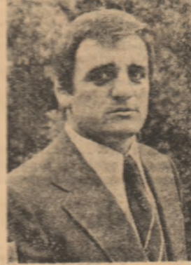
STELICĂ MORCOV medalie de bronz

S-a născut în București, la 20 septembrie 1947. Din 1963 a început să practice boxul la școala sportivă „Victorul” din Capitală (antrenor - Teodor Niculescu). În prezent face parte din clubul Rapid București - unde se pregătește sub îndrumarea aceluși antrenor. Performanțe anterioare: dublu vicecampion european (1969 și 1975).