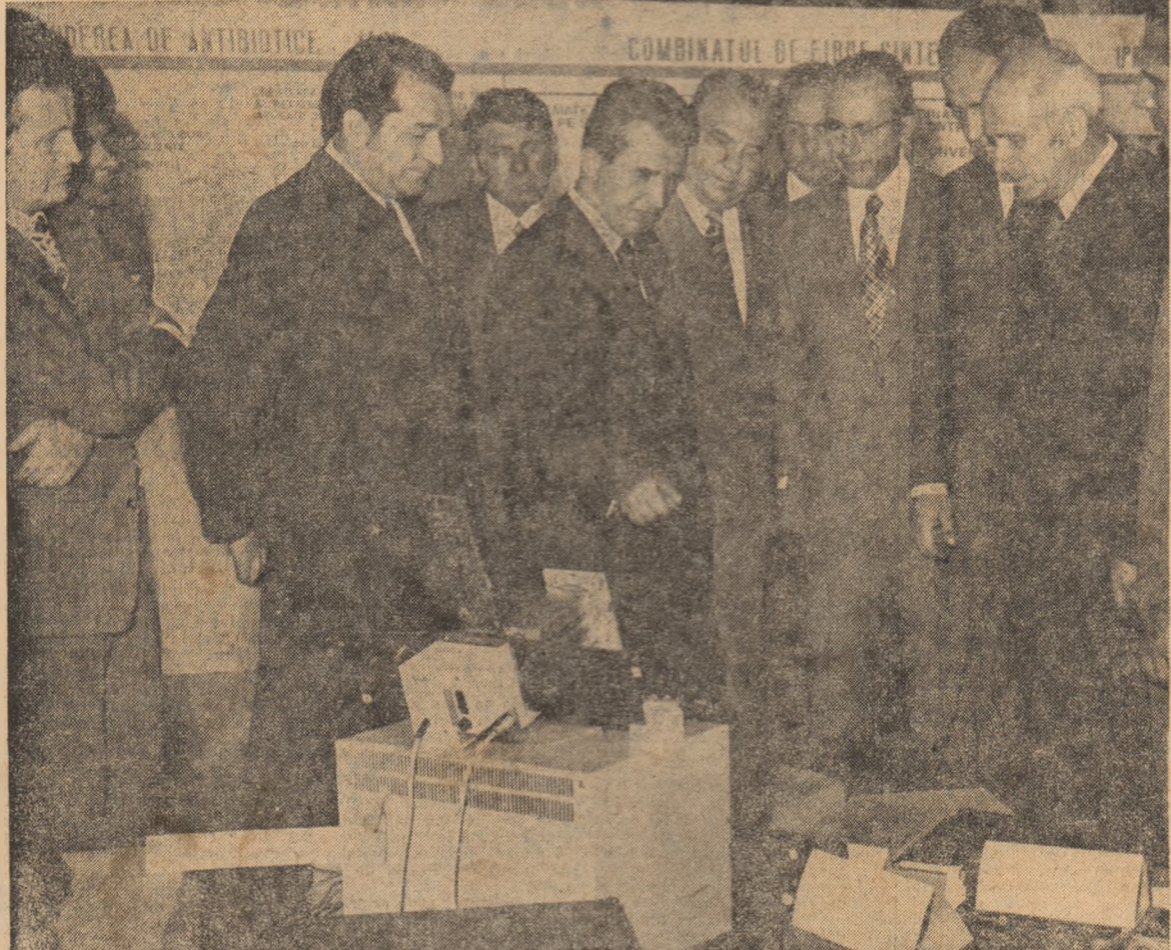
În modernele laboratoare ale noului complex de învățămînt-cercetare-producție al Institutului politehnic