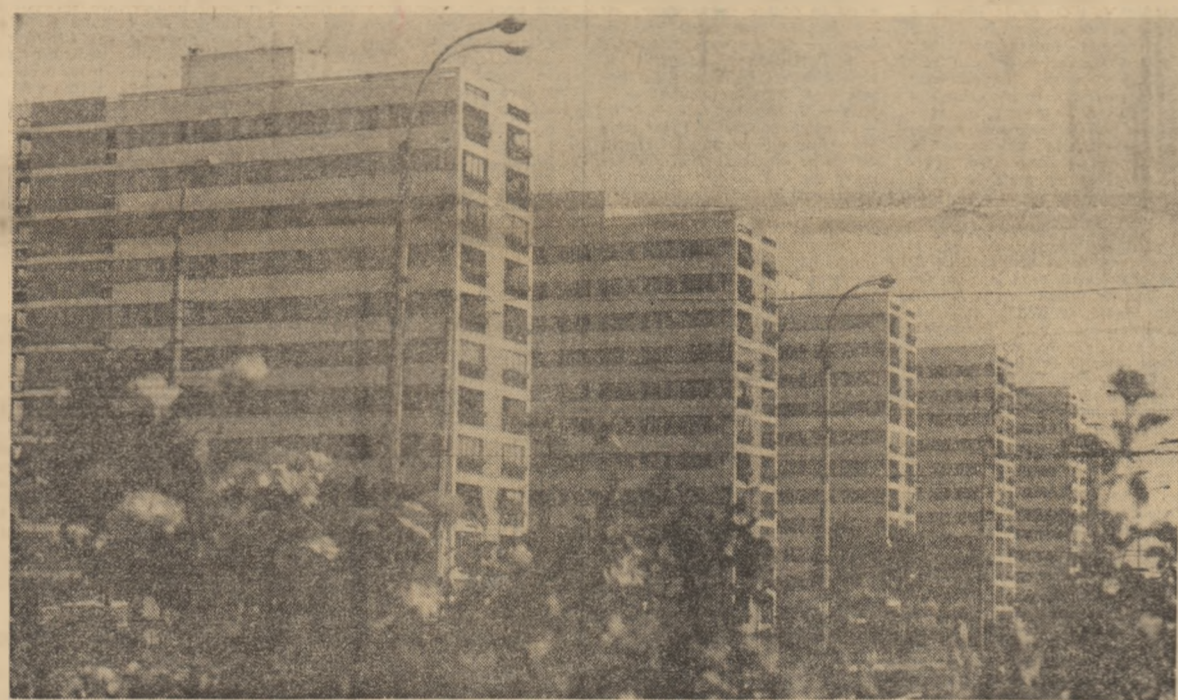
Cartierul Titan. Armonie în formă și culoare, confort și funcționalitate. Aceste cîteva cuvinte, ce conferă practic existenței o altă dimensiune, rezumă calificativul maxim pe care beneficiarii îl pot acorda...