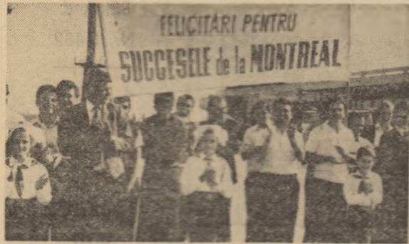
„FELICITĂRI PENTRU SUCESELE de la MONTREAL“