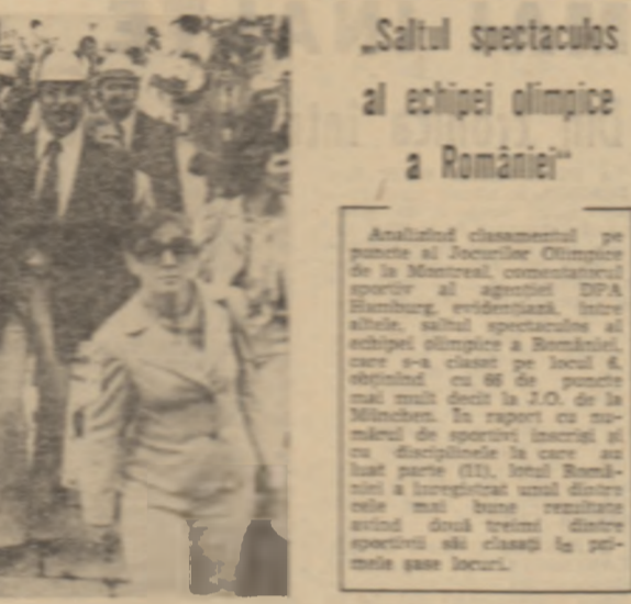
„Saltul spectaculos al echipei olimpice a României“