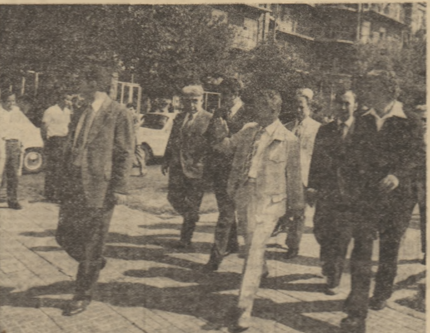
Pe străzile capitalei armenice — Erevan

matizării centrului civic al Erevanului, reconstituit în stilul specific al arhitecturii armenice. Este vizitat apoi impunătorul monument, ridicat pe una din colinele orașului, în memoria victimelor genocidului din aprilie 1915. În continuare, în frumosul „Parc al Victoriei”, situat pe o altă colină a capitalei armenice, este vizitat masivul monument „Patria mamă”, ridicat aici ca un simbol al hotărârii poporului armean de a-și apăra libertatea și independența, de a asigura progresul și înflorirea Armeniei, înaintarea ei continuă pe calea socialismului și păcii. Este vizitat, de asemenea, monumentul ridicat în onoarea celei de-a 50-a aniversări a Revoluției Socialiste din Octombrie.