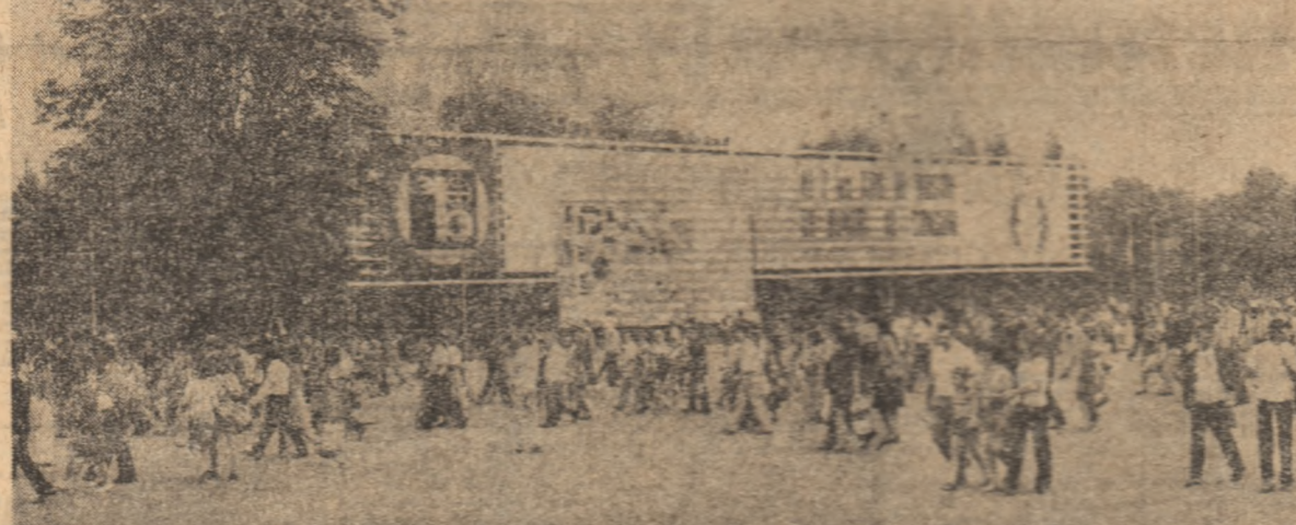
Cuprinzătoare imagine a dezvoltării economice a țării, elocventă demonstrație a înlăturării consecvențe a politicii partidului nostru