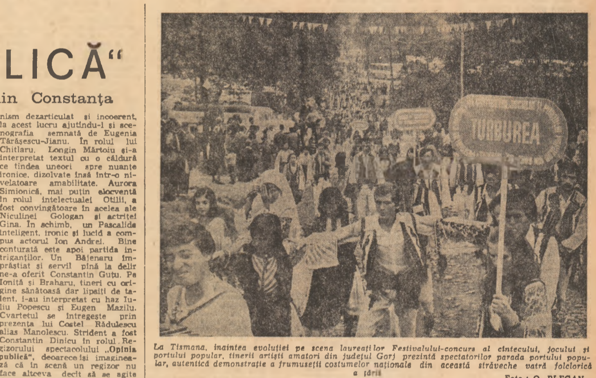
La Tismana, înaintea evoluției pe scena lucrărilor Festivalului-concurs al cîntecului, jocului și portului popular...