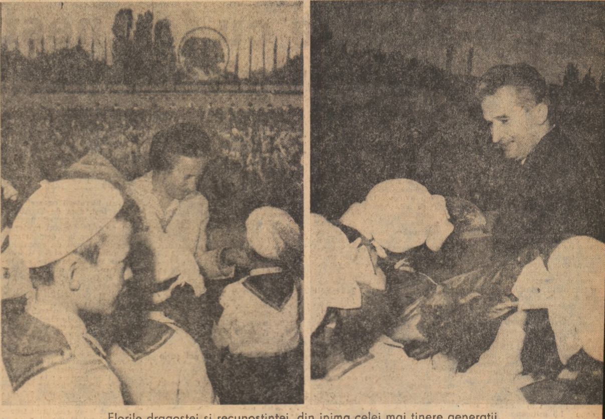
Florile dragostei și recunoștinței, din inima celei mai tinere generații.