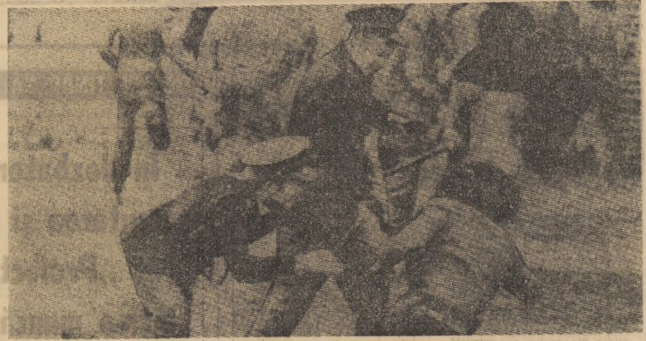
Aspect din timpul unei recente demonstrații a studenților sud-africani de la Universitatea din Capetown împotriva politicii de apartheid, demonstrație în timpul căreia forțele polițienești au intervenit cu brutalitate.

Prin urmare, România este de părere că orice problemă privind drepturile și interesele statelor într-o anumită zonă maritimă, inclusiv problemele delimitării teritoriale a acestor drepturi și interese, trebuie să fie soluționată pe cale pașnică și în conformitate cu principiile echității și justiției internaționale.