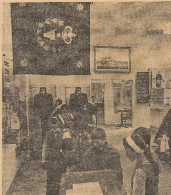
Pionieri din Constanța — poate mulți dintre ei temerari navigatori în viitor — parcurpung „filă” cu „filă” prestigioasă și eroica istorie a marinei românești